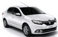
369 - Blanco Glaciar