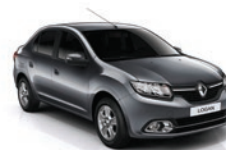
KNS - Gris Quartz