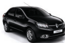
676 - Negro Nacré