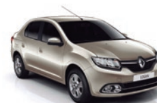
HNP - Beige Duna Acero