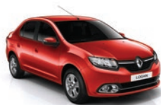
727 - Rojo Vivo